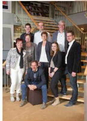
Ons team staat voor u klaar!